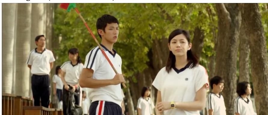
Beberapa adegan kedua karakter yang bertemu di bawah pohon