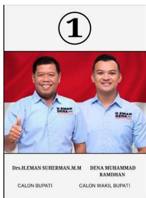
Gambar 1 Calon Bupati No 1