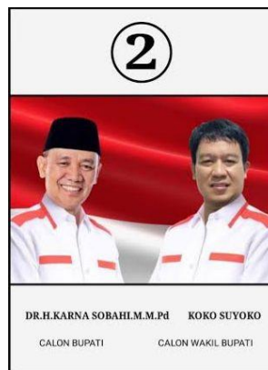
Gambar 2 Calon Bupati No 2

Minggu 22 September 2024 KPU Majalengka Menetapkan 2 pasangan Calon Peserta pemilihan Bupati dan wakil calon Bupati Majalengka tahun 2024 telah memenehi syarat. Adapun Propil dari kedua pasangan tersebut yaitu: