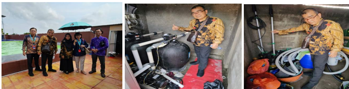
Gambar 3. Implementasi filter air dan Vacuum di kolam renang