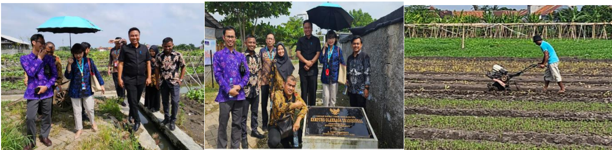
Gambar 2. Implementasi Traktor mini

Berdasarkan hasil observasi, evaluasi dan implementasi, ditemukan bahwa alat tepat guna yang diberikan telah dimanfaatkan dengan baik oleh masyarakat Kampung Tematik Waru Brilliant. Beberapa hasil signifikan yang diperoleh antara lain, Penggunaan alat tepat guna memungkinkan masyarakat untuk meningkatkan produksi pertanian dan usaha mikro secara lebih efisien. Disisi lain peningkatan efisiensi waktu dan biaya yang sebelumnya masyarakat membutuhkan waktu dan tenaga yang lebih besar dalam proses produksi, namun dengan adanya alat ini, proses menjadi lebih cepat dan hemat biaya. Sebagai akibat dari hal itu pendapatan masyarakat mengalami peningkatan sebagai akibat peningkatan produktivitas dan efisiensi dalam produksi, yang pada akhirnya ketersediaan pangan di wilayah tersebut menjadi lebih stabil.